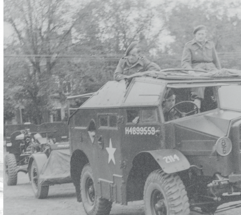
C8 Morris artillery tractor with ammunition trailer and a 25-pounder gun of the Brigade Piron, Glacis Square, Luxembourg City, 27 June 1945 © MNHM (K382_051)