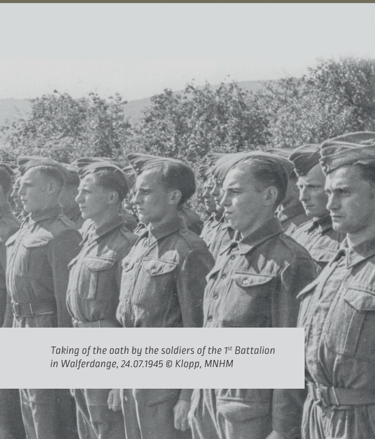
Taking of the oath by the soldiers of the 1 st Battalion in Walferdange, 24.07.1945

Die Ausstellung beleuchtet die Entwicklung seit 1943: Luxemburgs Beitrag in den alliierten Streitkräften mit Freiwilligen in der belgischen Brigade Piron, den mühsamen Wiederaufbau der Armee, ihre Verankerung in Staat und Gesellschaft sowie die Entwicklung militärischer Infrastrukturen.