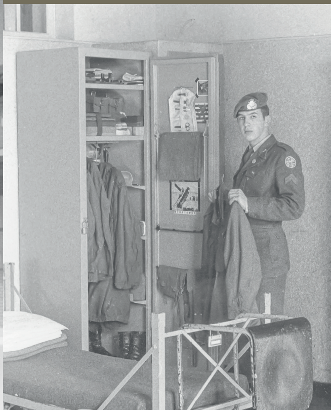
Soldier next to his locker and bed, 1957

A journey through the evolution of the Luxembourg Army.