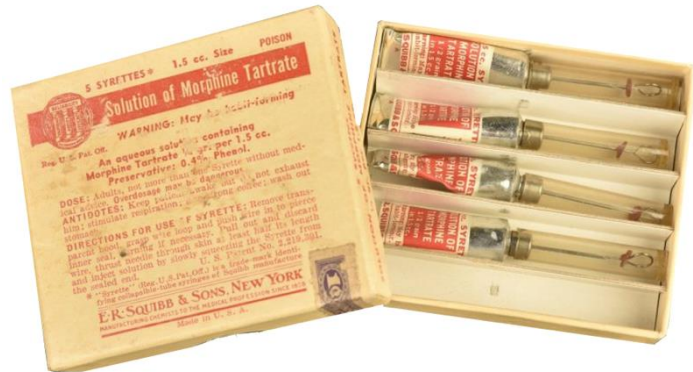
Boîte de morphine avec 5 ampoules

L'armée américaine disposait d'un système sophistiqué pour soigner ses soldats blessés de manière optimale.