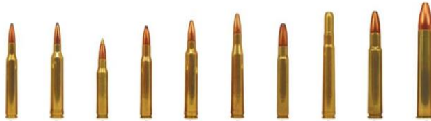
Différents calibres (munitions de fusil)

Le calibre est une mesure du diamètre des projectiles.