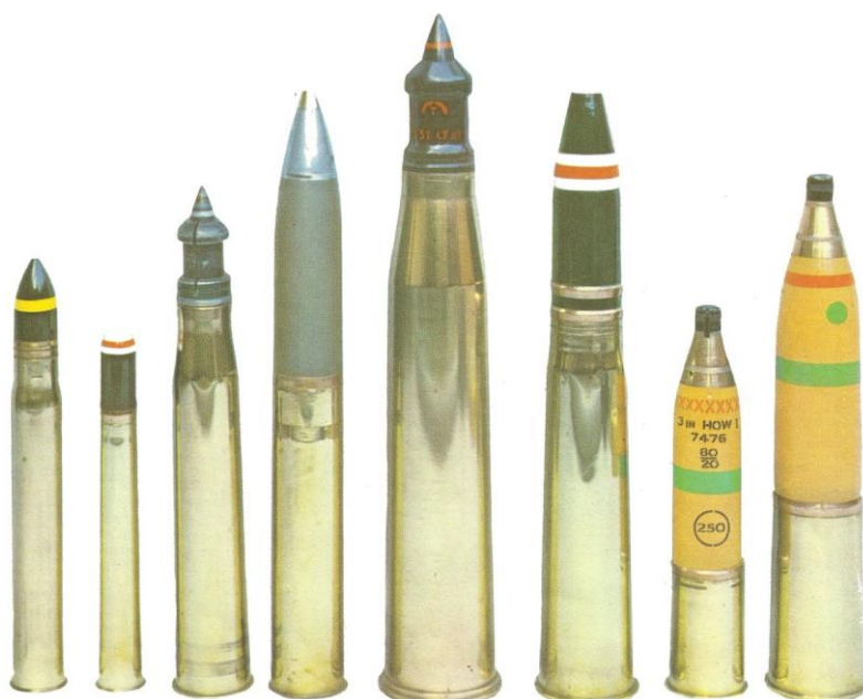
Diverses munitions d'artillerie

Cherchez sur Internet et découvrez à quelle fin on utilisait telle ou telle grenade !